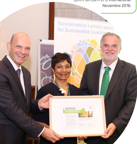
Foto: Re-homologación del Sistema CERTFOR con PEFC Internacional. Noviembre 2016.

El Sistema CERTFOR es administrado por la Corporación CertforChile de Certificación Forestal, entidad nacional privada sin fines de lucro, que promueve la gestión productiva de los bosques de manera amigable con el medio ambiente y responsable a nivel social.